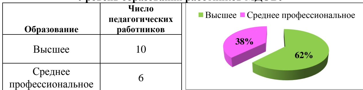
Уровень образования работников МДОБУ