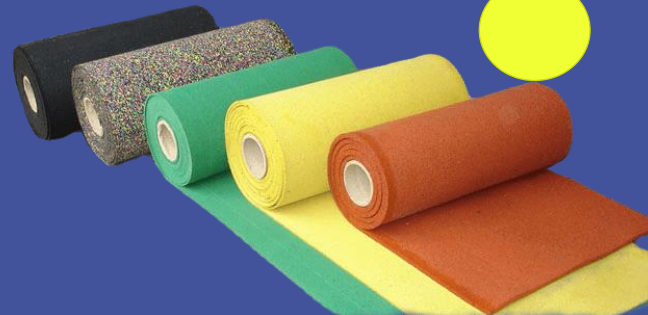
Резиновое спортивное покрытие