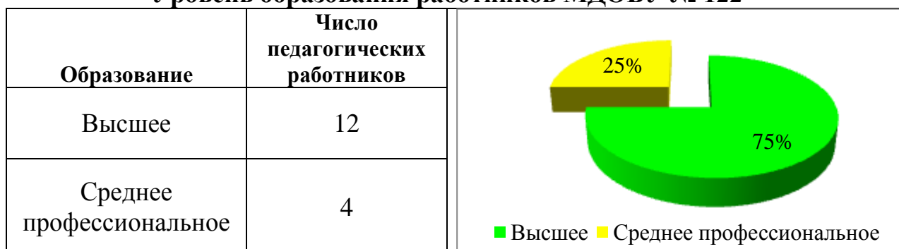
Уровень образования работников МДОБУ № 122